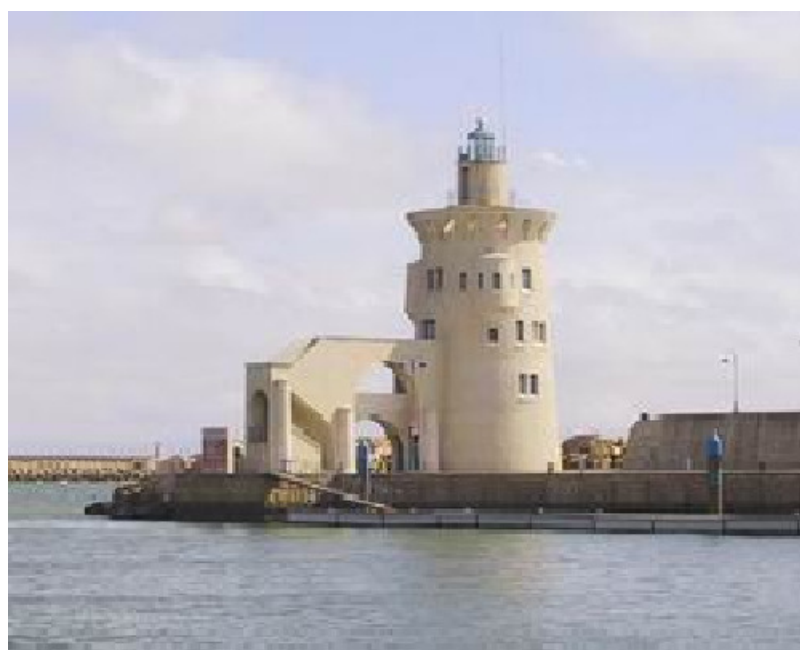
Capitanía Marítima y Faro de Puerto Sherry

EUROPEAN CHAMPIONSHIPS OF SKI RACING TO BE HELD FROM 21st TO 28th AUGUST 2010